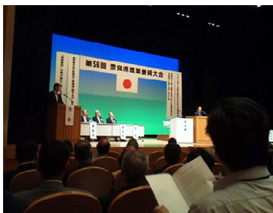
奈良県農業委員大会