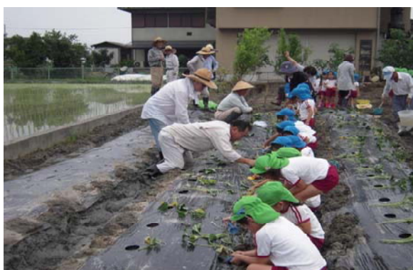
サツマイモの植え付け