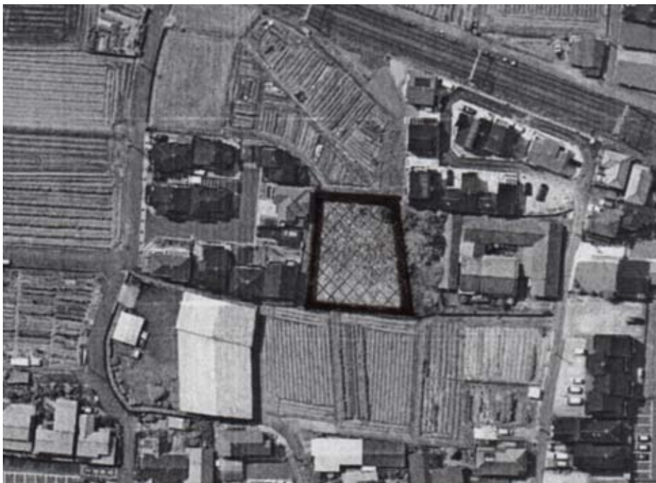
調査員による現地調査

このことから、特に市街化区域内においては、良好な環境の保全・貯水機能による防災の観点等からも、重要な役割を担っている農地が、逆に、雑草の繁茂による病害虫の発生や、防犯上の問題等を生じさせており、周辺住民からもその苦情も多く寄せられるようになってきています。また、営農に係る、農業者からの農地へのゴミ捨て等に対する苦情、周辺住民からの騒音や薬剤に対する苦情も時折寄せられており、農業従事者と周辺住民との良好な関係づくりが課題となってきている。